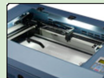
LED beleuchtete Arbeitsfläche