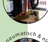
pneumatisch & elektr. Bohrkopf