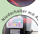
Niederhalter mit Absaugung